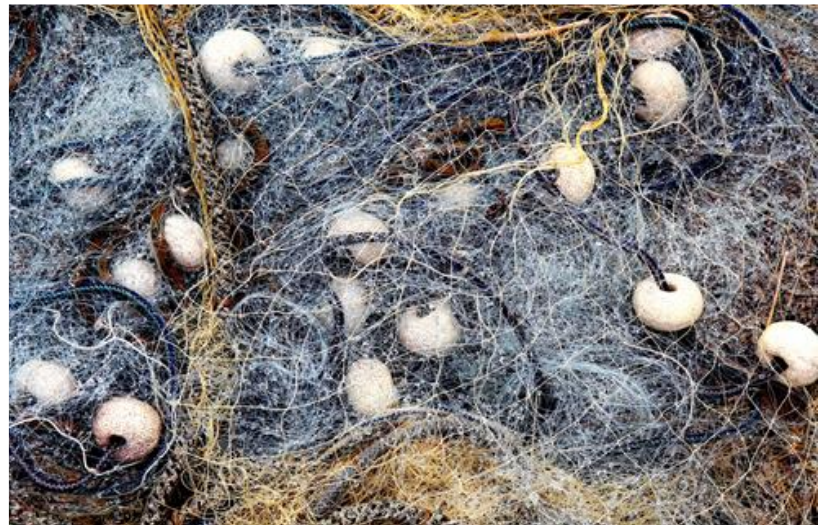
aus Pfarrbriefservice: Fischernetz 3 von Peter Weidemann

Und dann lassen wir es beim Alten; übergehen jede Hilfe und machen weiter unser Ding.